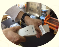
バーコードで管理

現在多くの病院で医療情報の電子化が進んでいます。診療に関するすべての情報が電子カルテシステムによって管理されますので、当該病院内であれば、いつ、どこでもカルテを見たり、記載したり、検査結果を見ることができ、又、それらの情報を抽出し研究に利用することも可能です。 しかし、特に外来業務においては医師への負担が格段に増えます。診療の他にカルテ記載、検査や入院の指示、紹介状作成など、限られた時間内に多くの情報をパソコンに入力しなければならぬからです。 当然、外来診療時間が長くなりま す。小国公立病院でも先日（1月19日）電子カルテシステムが稼働しました。職員がこのシステムに慣れるまでの間、待ち時間が長くなる等のご迷惑や不都合が生じると思いますが、ご協力ご支援をお願い致します。