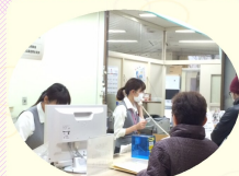
受付はまだ大忙し