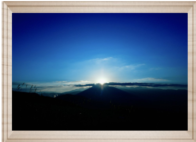
『令和初の初日の出』 (撮影者：市川 外来看護師)